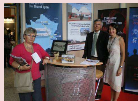
Salon Des Entrepreneurs de Lyon 2011